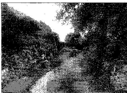
Una parte del Camí Vell de Sant Climent ya se ha desbrozado.

Durante 2010, el Ajuntament ha destinado unos 500.000 euros a actuaciones de este tipo, destinadas a mantener en buen estado algunos de los 66 caminos rurales y cerca de treinta parques y zonas verdes que recorren el término municipal. En estas tareas colaboran la brigada municipal, la empresa FCC y personal del Consell, de forma ocasional.