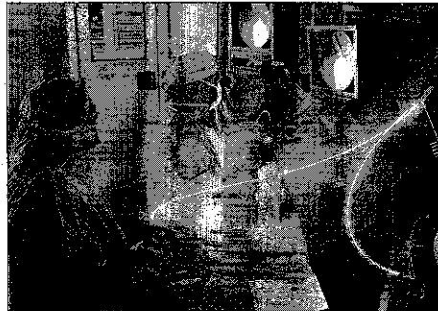
La tecnología láser ha permitido avanzar en muchos campos.