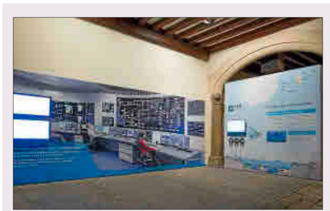
Parte de la exposición dedicada a Red Eléctrica. REE

Por otro lado, hay también un espacio expositivo relativo al funcionamiento del sistema eléctrico y al papel de Red Eléctrica de España (REE) en éste, como operador y transportista. Además, en este apartado expositivo se pueden contemplar los principales proyectos que REE tiene en Baleares en materia de interconexiones eléctricas submarinas.