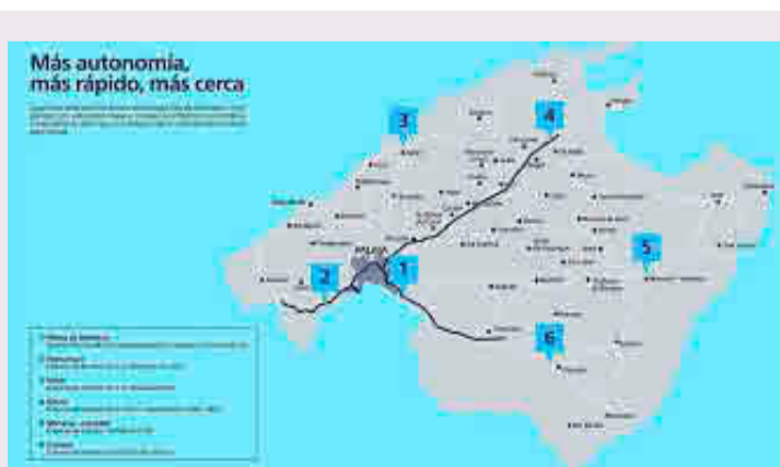
Red de electrolineras de carga rápida en Mallorca.

MOVITUR es un proyecto cofinanciado por el Ministerio de Industria, Turismo y Comercio que pretende movilizar el triplete involucrado en transporte eléctrico (productores de energía, rent-a-cars y administración pública) para el desarrollo del uso de la movilidad eléctrica y la diferenciación del destino turístico Illes Balears.