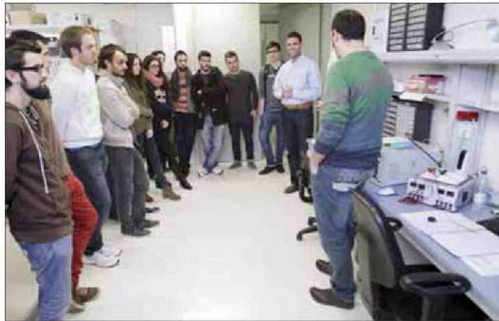
Los alumnos visitaron el laboratorio de fotónica y computación. ■ Foto: P.B.