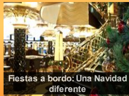
Fiestas a bordo: Una Navidad diferente