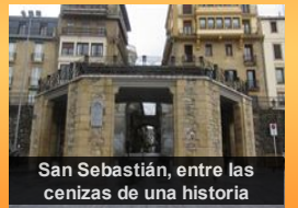
San Sebastián, entre las cenizas de una historia