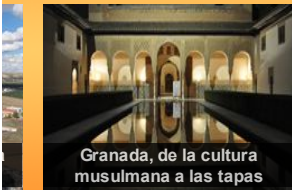
Granada, de la cultura musulmana a las tapas