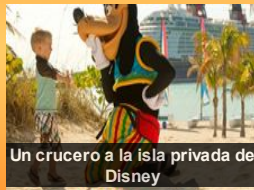
Un crucero a la isla privada de Disney