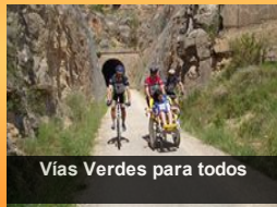
Vías Verdes para todos