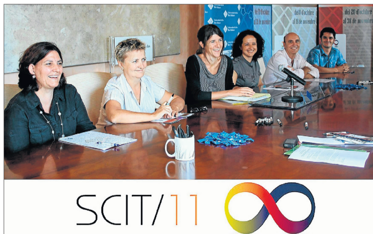
Acto de presentación de la Semana de la Ciencia en la UIB.

Con el lema 'Química: nuestra vida, nuestro futuro', la ONU ha declarado 2011 el Año Internacio-